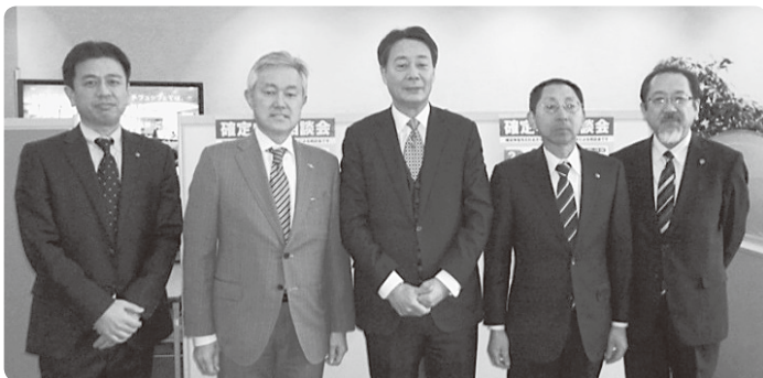
海江田万里前衆議院議員確定申告相談会視察