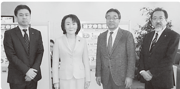
山田美樹衆議院議員確定申告相談会視察